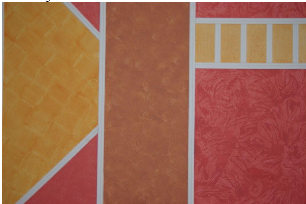
Obr. 2 – originální vzhled

Efectos je velmi jednoduchý na aplikaci, tónuje se na automatických tónovacích strojích do odstínů dle výběru zákazníka, vytváří zcela hladký omyvatelný a velmi jednoduše čistitelný povrch s jemným saténovým leskem. Není klasickým malířským krycím nátěrem, vytváří lazurovací efekt, podklad prosvítá v návaznosti na sytost a probarvení odstínu nebo naaplikovanou vrstvu nátěru.