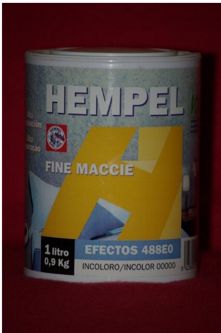
Obr. 1 – 488E0 EFECTOS

HEMPEL'S EFECTOS 488E0 je multieffektní vodou ředitelný interiérový lak s hedvábným leskem. Používá se jako finální dekorativní úprava běžných vnitřních omítek, štuků, betonových podkladů, sádkartonu, umakartu, dřevotřískových a cementopískových panelů. Efectos dává velký prostor pro fantazii zákazníka, nabízí různé způsoby aplikace a tím také různé finální efekty a téměř vždy originální vzhled. Dle způsobu nanášení dosáhneme semišových, zrnitých, mramorových nebo stínových efektů.