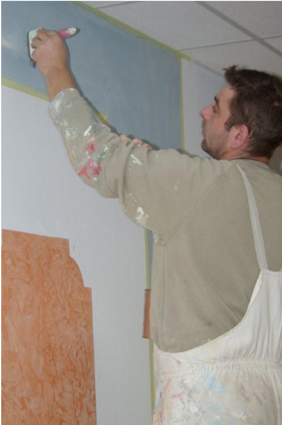
Obr. 3 – nanášení štětcem

do zaschnutí nátěru upravit vhodnou dekorativní technikou, výrobce doporučuje plochu o velikosti 4-6 m 2 .