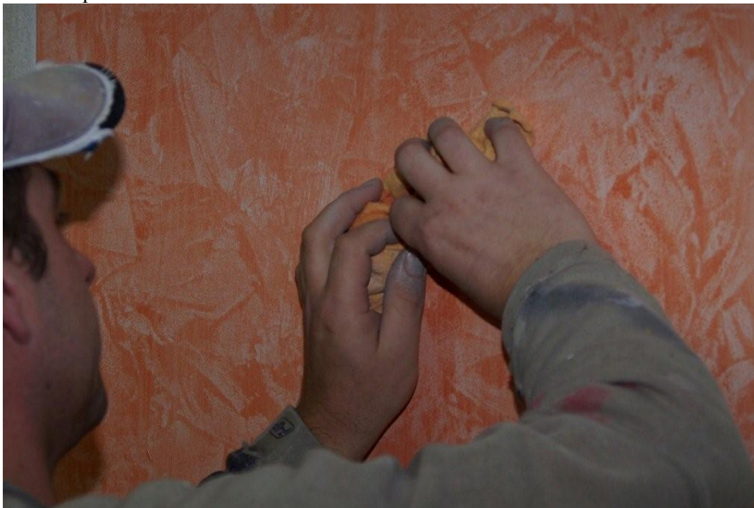
Obr. 4 – použití hadru