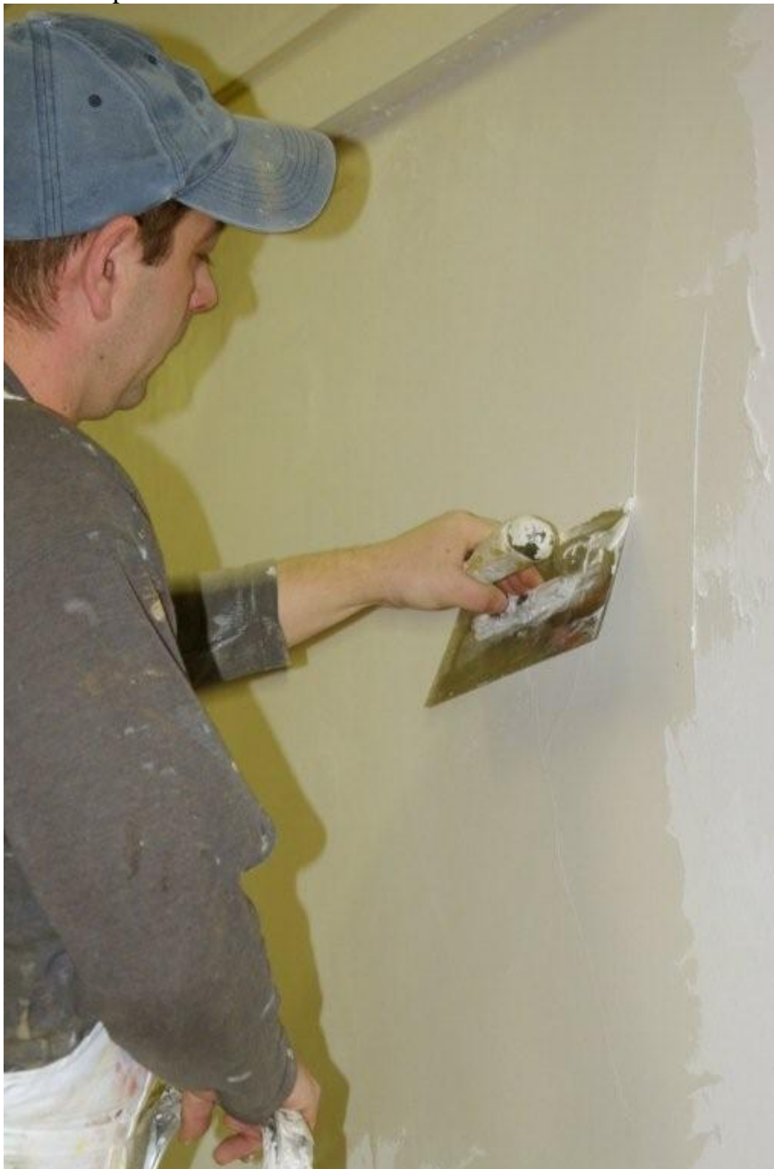
Obr. 1. Aplikace Ditmel S

Využití interiérových stěrkových tmelů nemusí být vždy jen to klasické vyrovnaní zdí do dokonale hladkého povrchu, který následně přetíráme nátěrovou hmotou do zvoleného barevného odstínu.