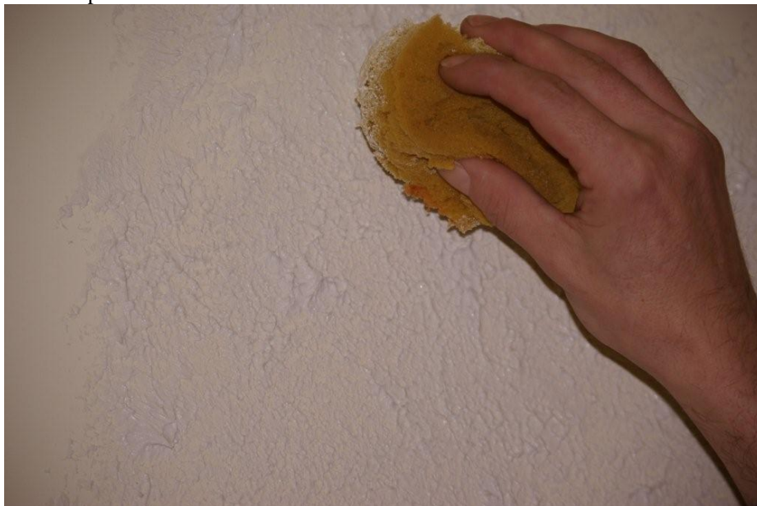
Obr. 4. Aplikace houbou

Touto technikou docílíme povrchu, který je místy ošetřený nesavým nátěrem, ale místy velmi savým stěrkovým tmelem. Tento povrch s rozdílnou savostí opatříme nátěrem hmotou HEMPALUX 10 odstín aluminio a vznikne velmi zajímavý povrch, kde nátěrová hmota na nesavých částech povrchu zůstává lesklá, ale na savém povrchu zmatovává.