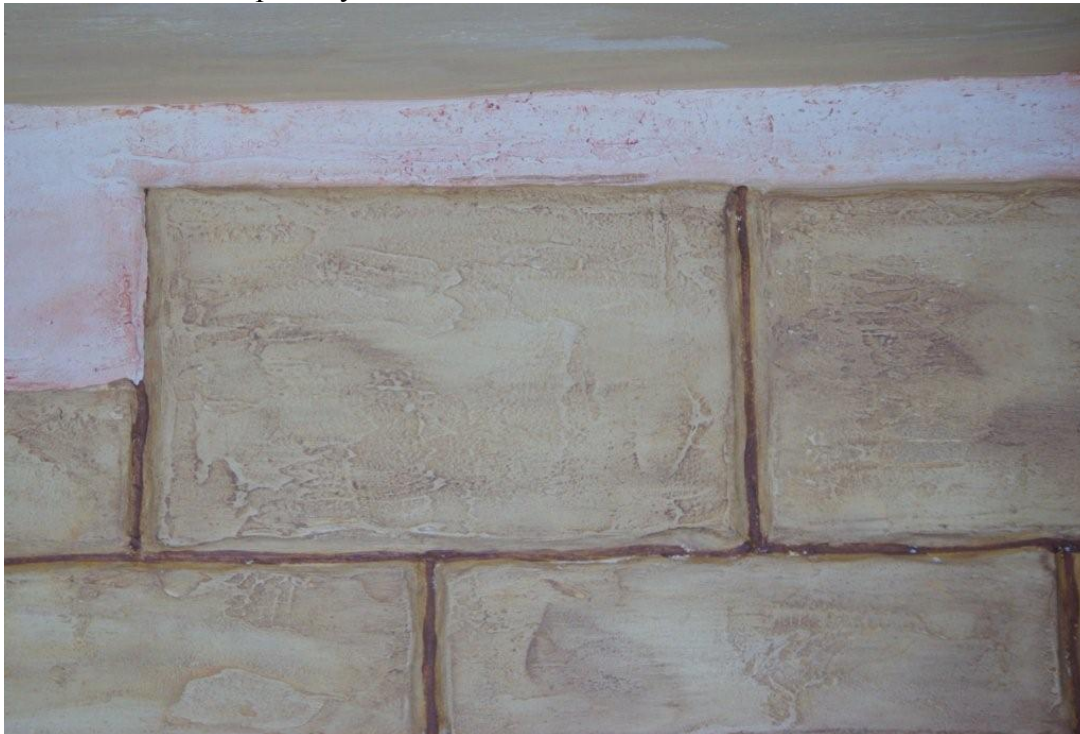
Obr. 8. RUSTIK napuštěný voskem

Po vyschutí napustíme povrch syntetickým voskem HEMPEL'S CERA DECORATIVA, který po zaschnutí vyleštíme do požadovaného lesku. Vosk můžeme nahradit matnou omyvatelnou malbou HEMPATONE EXTRA. Vosk i malbu lze tónovat do velké škály odstínů.