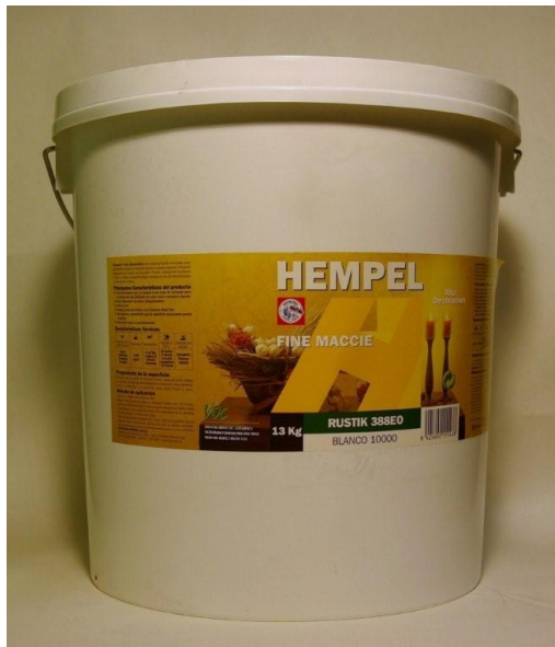
Obr. 7. HEMPEL´S RUSTIK

Poté aplikujeme stěrkovou hmotu HEMPEL´S RUSTIK ve slabé vrstvě tak, abychom napodobily přírodní strukturu kamene.