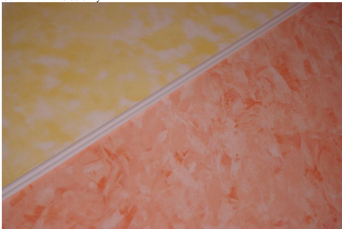
Obr. 2. Ditmél S barevný

Další zajímavou možností použití sěrkového tmelu je kombinace s moderními odstíny chromu nebo hliníku. Povrch si připravíme nesavým omyvatelným nátěrem např. HEMPATONE EXTRA (Obr. 3.) a poté aplikujeme sěrkový tmel tak, abychom dosáhli nerovnoměrného strukturního povrchu. Vhodným nářadím je například houba nebo hladítko, které namáčíme a nepravidelným tiskáním na omítku docílíme požadované struktury a vzhledu. Strukturu povrchu ovlivníme především právě použitým nářadím nebo případným lehkým příděním sěrkové hmoty.